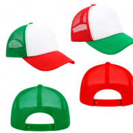
◀ DOUG GO 011

Gorra de acrílico con 6 gajos, broche de velcro y visera. Material: Acrílico. Medida: 17 x 27 x 7.0 cm.