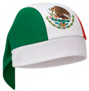
◀ MARTINOLI MX 002

Sombrero plegable. Material: Poliéster. Medida: 9 x 15 x 37 cm.