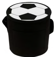
◀ GERARD LON 069

Lonchera con un compartimento, interior permeable, cierre, print de balón de soccer en los laterales y correa ajustable. Material: Poliéster. Medida: 23.5 x 23 x 20 cm.