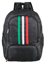
◀ RIVALDO BL 336

Mochila tipo back pack con print de balón, bolsa principal, bolsa frontal de cierre, asa superior y correas ajustables. Material: Poliéster. Medida: 40 x 27.5 x 11.5 cm.