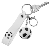
◀ REGATE MK 067

Molde para hielo en forma de balón de fútbol. Material: Silicón. Medida: 5.4 x 6.2 cm.