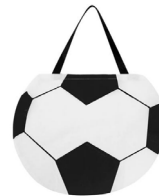
◀ BOLSA BALÓN SIN 250

Bolsa-mochila con diseño inspirado en México. Tirantes de cordón y jareta. Material: Non Woven / Poliéster. Medida: 36.5 x 44 cm.