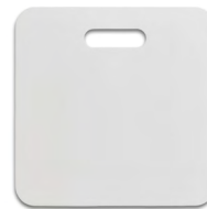
◀ BANCA MX 010

Frisbee plegable de poliéster con print de balón de soccer y funda. Material: Poliéster. Medida: 10.5 x 9.7 cm.