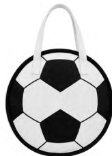
◀ CHANFLE MX 024

Lonchera con un compartimento interior permeable, cierre, print de balón de soccer y asas. Material: Poliéster. Medida: 25.5 x 25.5 x 11.5 cm.