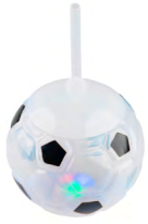
◀ GAMBETA T 332

Cilindro con forma de balón de soccer, listón, popote y luz de 3 colores. Material: Plástico. Capacidad: 500 ml. Medida: 10.5 x 10.6 cm.