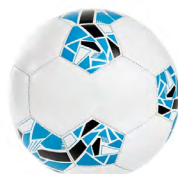
◀ BALÓN CAFÚ SOC 850

Balón de fútbol No. 5 con 35 gajos. Peso 400 gr. Cosido a máquina. Nivel máximo de presión 6-8 psi. Capa especial de PVC.