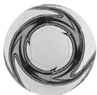
◀ BALÓN SPACE SOC 650

Balón de fútbol No. 5 con diseño clásico de 35 gajos. Peso 400 gr. Cosido a máquina. Nivel máximo de presión 6-8 psi. Capa especial de PVC.