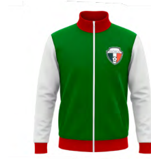
◀ CHILENA BL 333

Playera de poliéster con logo impreso de México. Material: Poliéster.