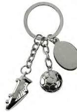
◀ LLAVERO SOCCER SOC 427

Cuenta con asa superior y compartimento principal. Al frente incluye malla frontal que permite la ventilación. Material: Poliéster. Medida: 20 x 34 x 16 cm.