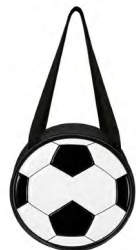
◀ SUPA LON 068

Hielera con interior impermeable, cierre y ventana con velcro para fácil acceso en la parte superior, asas y soporte de metal plegable. Material: Poliéster. Medida: 38.5 x 45 cm.