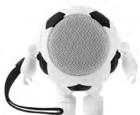
◀ BOCINA SOCCER SOC 020

Bocina bluetooth 5.0 en forma de balón. Con potencia de 3 W y batería recargable de 1,000 mAh. Hasta 8 horas de música. Material: Plástico. Medida: 9 x 8.2 x 6.2 cm.