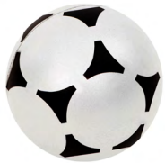
◀ FUT LP 36

Mini pelota de fútbol con acabado rubber. Material: Plástico. Medida: 6 cm.