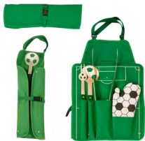
◀ SUNDAY HO 177

Destapador con imán. Material: Plástico / Metal. Medida extendido: 6.7 cm.