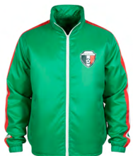
◀ HINCHA BL 339

Sudadera tricolor con logo impreso de México. Material: Poliéster.