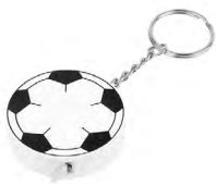
◀ FLEXÓMETRO SOCCER BALL SOC 005

Incluye placa para grabado, 1 dije de zapato soccer y 1 dije de balón. Material: Metal. Medida: 3.4 x 10.3 cm.