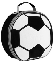
◀ LONCHERA SOCCER BALL SOC 047

Lonchera rígida con asa. Material: Plástico. Medida: 19 x 23.3 cm.