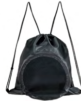
◀ PENAL BL 332

Portería plegable de poliéster con broches de velcro, 4 asas y 4 estacas de metal para fijarla al suelo. Incluye funda. Material: Poliéster. Medida: 72 x 111 cm.