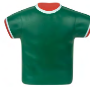
◀ ANTI-STRESS MEXICO SOC 010

Silla plegable con reposabrazos, porta vasos de malla, funda con jareta y correa. Material: Poliéster Silla / Acero Estructura. Medida: 80 x 80 x 43 cm.