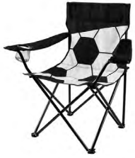
◀ SILLA SOCCER SOC 412

Silla plegable con reposabrazos, porta vasos de malla, funda con jareta y correa. Material: Poliéster Silla / Acero Estructura. Medida: 80 x 80 x 43 cm.