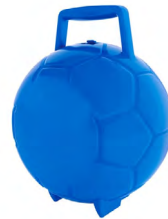
◀ LONCHERA GOL SOC 078

Lonchera con Interior plastificado impermeable. Capacidad para 6 latas. Material: Poliéster. Medida: 19 x 14.5 x 13 cm.