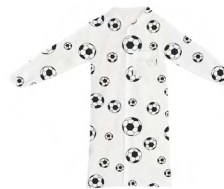
◀ BOMBONERA PM 25

Rompevientos con logo impreso de México, bolsas laterales, resorte en las mangas y gorro plegable oculto en el cuello. Material: Poliéster.