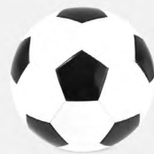
◀ BALÓN SOCCER SOC 436

Balón de fútbol con 32 gajos. Cámara rubber bladder. Peso 160-180 gr. Cosido a máquina. 1 Capa. Nivel máximo de presión 4-6 psi. Grosor EVA 2.6mm.