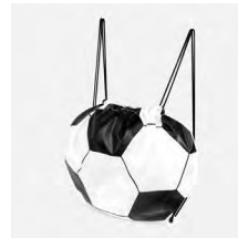
◀ BOLSA-MOCHILA SOCCER SOC 350

Bolsa-mochila con diseño de balón de fútbol. Material: Poliéster. Medida: 38 x 46 cm.