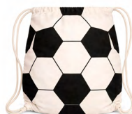
◀ BALOX BL 350

Bolsa ecológica de non woven de 80 gr/m2, laminada y termo sellada. Material: Non Woven. Medida: 30 x 41 x 18 cm.