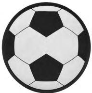
◀ MARK TL 059

Lentes de plástico con print de balón de soccer. Material: Polipropileno. Medida: 4.7 x 14.5 cm.