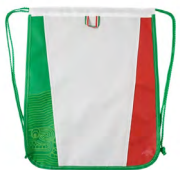
◀ BOLSA-MOCHILA MÉXICO SOC 075

Bolsa-mochila con diseño de balón de fútbol y cordones ajustables. Material: Poliéster. Medida: 42 x 34.5 cm