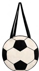
◀ MEI BL 351

Morral de algodón con diseño de balón de soccer. Material: Algodón. Medida: 38 x 34.2 cm.