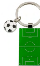
◀ CANCHA MK 068

Llavero circular con acabado rubber, diseño de balón de soccer y aro reforzado. Material: Metal / Rubber. Medida: 4.5 cm.