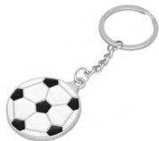
◀ ARAUJO MK 033

Llavero metálico con forma de cancha de fútbol, balón y aro reforzado. Material: Metal. Medida: 4.5 x 2.5 x 0.1 cm.