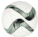
◀ MINI BALÓN ARGO SOC 660

Balón de fútbol con 32 gajos. Cámara rubber bladder. Peso 160-180 gr. Cosido a máquina. 1 Capa. Nivel máximo de presión 4-6 psi. Grosor EVA 2.6mm.