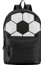
◀ RONALDO BL 338

Mochila con compartimento principal, un compartimento frontal con cierre, tirantes ajustables y asa superior. Material: Poliéster. Medida: 40.5 x 27 x 10.5 cm.