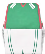
◀ RANDY MX 027

Hielera con interior impermeable plástificado, compartimento con cierre en la parte frontal, correa ajustable y print de balón de soccer. Material: Poliéster. Medida: 27 x 27.5 x 13.5 cm.