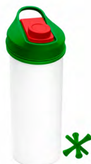
◀ TAIRO MEXA T 322 MX

Cilindro con tapa enroscable. Material: PET / Polipropileno. Capacidad: 500 ml. Medida: 19 x 7 cm.