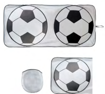
◀ PORTERIA BL 331

Bolsa de algodón con forma de camiseta, asas y escudo de México. Material: Algodón. Medida: 33 x 42.2 x 39.5 cm.