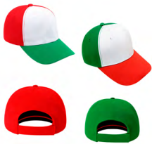
◀ GOOF GO 008

Pelota antiestrés en forma de balón de fútbol soccer. Material: Poliuretano. Medida: 6.3 cm.