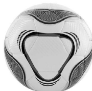
◀ BALÓN SPORT SOC 350

Balón de fútbol con 32 gajos. Cámara winding bladder. Peso 400 a 450 gr. Cosido a máquina. 3 Capas. Nivel máximo de presión 6-8 psi. Grosor EVA 2.6mm.