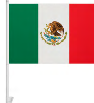
◀ BANDERAZO MX 018

Mano aplaudidora con forma de balón. Material: Plástico. Medida: 17.4x 8.5 cm.