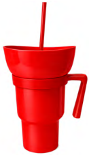
◀ GRIFFIN T 333

Cilindro de silicón con forma de balón de futbol que se extiende y contrae, cuenta con tapa enroscable, boquilla con tapa de seguridad. Material: Silicón. Capacidad: 520 ml. Medida extendido: 12 x 8.7 cm.