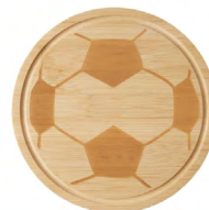
◀ TABLA SOCCER SOC 971

Lonchera con Interior plastificado y cierre exterior. Incluye asa en la parte superior. Material: Poliéster / EVA. Medida: 26 x 26 x 8 cm.