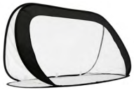
◀ IKER TL 011

Impermeable con estuche de balón y gancho para mejor sujeción. Material: Plástico. Medida: 6.4 cm.