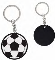
◀ BRAZUCA MK 065

Llavero metálico de balón de soccer. Material: Metal. Medida: 9.2 x 3.1 cm.