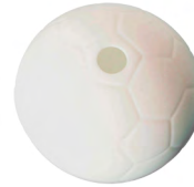
◀ TELSTAR HO 179

Set de BBQ en estuche con diseño de cancha de fútbol que también funciona como mandil. Incluye guante, pinzas, tenedor asador y volteador. Material: Poliéster / Acero Inoxidable. Medida mandil: 60.5 x 46 cm.