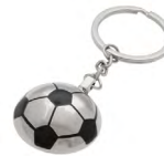
◀ ARSENAL MK 032

Llavero con pelota de soccer, aro para llaves y gancho para mejor sujeción. Material: Silicón. Medida: 10 x 2 cm.