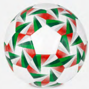
◀ BALÓN DE FÚTBOL MÉXICO SOC 435

Balón de fútbol No. 5 con 35 gajos. Peso 400 gr. Cosido a máquina. Nivel máximo de presión 6-8 psi. Capa especial de PVC.