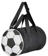
◀ LAUTARO BL 334

Zapatera de poliéster con print de balón de soccer, asa superior, malla y cierre. Material: Poliéster. Medida: 34 x 20.5 cm.