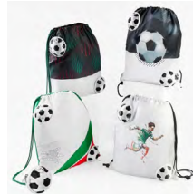
◀ BOLSA-MOCHILA MÁGICA SOCCER SOC 413

Con cierre de jareta, se guarda por dentro de un estuche con cierre en forma de balón. Material: Poliéster / EVA. Medida bolsa: 34 x 42 cm. Medida balón: 9.5 cm.