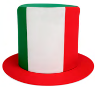
◀ CHUTE MX 016

Sombrero con print de balón de soccer con interior forrado. Material: Poliéster. Medida: 9 x 17 x 29 cm.