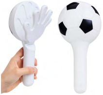
◀ BECKER MX 014

Aplaudidor en forma de balón de soccer Material: Plástico. Medida: 25.5x 9 cm.