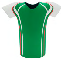
◀ CHELI MX 006

Porta cerveza en forma de camiseta de la selección mexicana. Material: Neopreno. Medida: 15.5 x 16 cm.