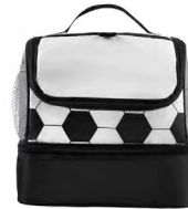
◀ LONCHERA SOCCER SOC 093

Memoria USB de 8 GB. Fabricada en plástico. Incluye llavero metálico con placa para personalizar. Material: Plástico. Medida: 4.1 cm.