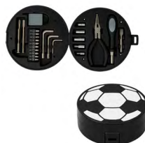
◀ PASCAL MX 023

Parasol panorámico plegable de poliéster para auto con impresión de balón y funda para guardar. Material: Poliéster. Medida: 65.5 x 50.5 cm.