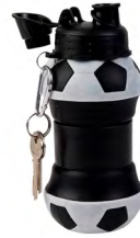
◀ FEVER T 303

Cilindro con forma de balón de soccer, listón, popote y luz de 3 colores. Material: Plástico. Capacidad: 500 ml. Medida: 10.5 x 10.6 cm.