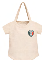
◀ AXEL BL 352

Bolsa con forma y print de balón de soccer y asas. Material: Algodón. Medida: 28.5 x 28.5 x 10 cm.