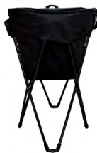
◀ FUTRIX LON 070

Lonchera tricolor con compartimento principal con cierre, mallas laterales y correa ajustable. Material: Poliéster. Medida: 28.8 x 21.3 x 14.5 cm.