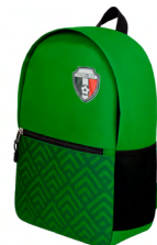
◀ NEYMAR BL 343

Necesar con compartimento principal, compartimento frontal con cierre y asa. Material: Poliéster. Medida: 14 x 25 x 7.6 cm.