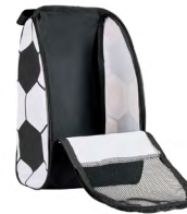
◀ KYLIAN BL 335

Morrál de poliéster con diseño de balón de soccer. Material: Poliéster. Medida: 42 x 39 cm.