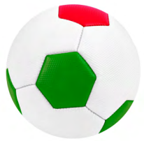
◀ BALÓN PIRLO FUT 004

Talla 2 con doble capa, compuesto por 32 paneles cosidos y acabado texturizado. Presión recomendada: entre 2 y 4 psi. Material: PVC. Medida: 14.64 cm.