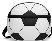
◀ GOLIN MX 025

Lonchera con un compartimento interior permeable, cierre, print de balón de soccer y asa. Material: Poliéster. Medida: 4.5 x 24.5 x 25.5 cm.