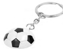
◀ LLAVERO GOL SOC 045

Llavero con diseño de balón de fútbol con flexómetro metálico de 1 m. Material: Plástico. Medida: 4 cm.