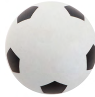
◀ CORNER TL 044

Mini pelota de fútbol con acabado rubber. Material: Plástico. Medida: 6 cm.