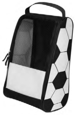
◀ ZAPATERA SOCCER SOC 432

Cuenta con asa superior y compartimento principal. Al frente incluye malla frontal que permite la ventilación. Material: Poliéster. Medida: 20 x 34 x 16 cm.