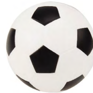
◀ SOCCER LP 09

Pelota de fútbol antiestrés. Material: Poliuretano. Medida: 6.2 cm.