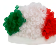
◀ KEMPES MX 001

Bandana tricolor. Material: Poliéster. Medida: 36 x 70 cm.