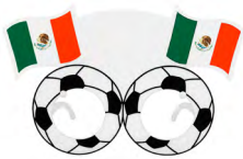
◀ BLAZE MX 021

Bandera para auto. Material: Poliéster. Medida: 29.5x 43 cm.