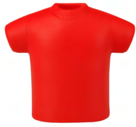
◀ GOLEX LP 38

Antiestrés en forma de playera. Material: Poliéster. Medida: 8.1 x 5 cm.