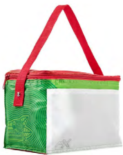
◀ LONCHERA MÉXICO SOC 091

Lonchera con interior plastificado. Bolsa lateral de red y asa de agarre superior. Capacidad para 9 latas. Material: Poliéster. Medida: 24 x 24 x 17 cm.