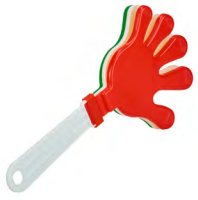
◀ PALMAS MX 008

Aplaudidor en forma de mano. Material: Plástico. Medida: 27.2 x 13cm.