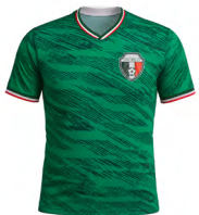
◀ TRICOLOR MX 007

Gorra tricolor con malla de 6 gajos y broche snapback. Material: Poliéster. Medida: 18 x 26.5 x 7 cm.