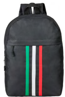
◀ CASILLAS BL 337

Mochila con compartimento principal, un compartimento frontal con cierre, tirantes ajustables y asa superior. Material: Poliéster. Medida: 40.5 x 27 x 10.5 cm.