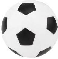
◀ PELOTA ANTI-STRESS FÚTBOL SOC 011-01