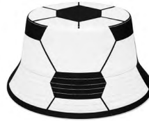
◀ ROSS SOC 979

Talla 2 con doble capa, compuesto por 32 paneles cosidos y acabado texturizado. Presión recomendada: entre 2 y 4 psi. Material: PVC. Medida: 14.64 cm.