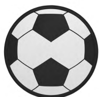
◀ SHAKES O 162

Set de herramientas con print de balón de soccer. Contiene: 1 pinzas, 1 destornillador, 2 extensibles, 5 dados, 10 puntas, 3 llaves Allen y 1 flexómetro. Material: ABS/Acero Inoxidable. Medida: 5 x 16 cm.